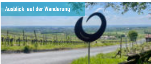
Ausblick auf der Wanderung