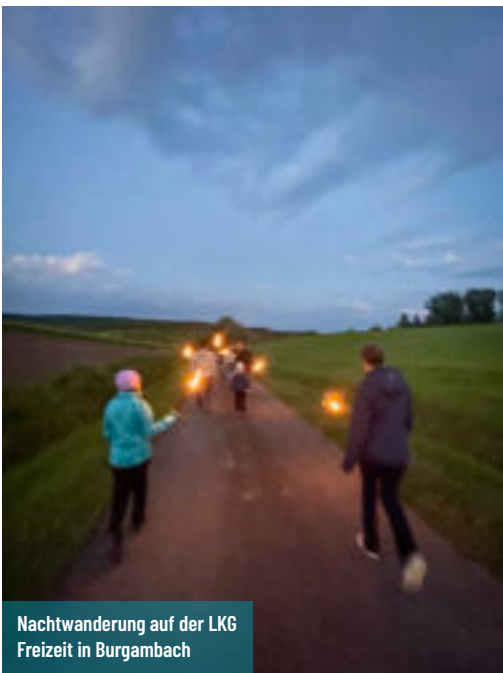
Nachtwanderung auf der LKG Freizeit in Burgambach