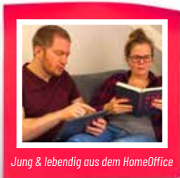
Jung & lebendig aus dem HomeOffice